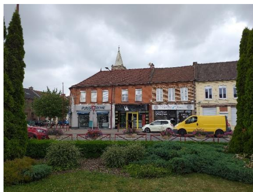
Figure 1 - Commerces dans le centre-ville

La richesse du cadre de vie passe par la présence d'une diversité de commerces et de services importante dans le centre-ville notamment. Les élus veulent favoriser le maintien et le développement de cette richesse dans la centralité commerciale définie dans le SCOT 1 , la commune étant classée comme pôle de proximité.