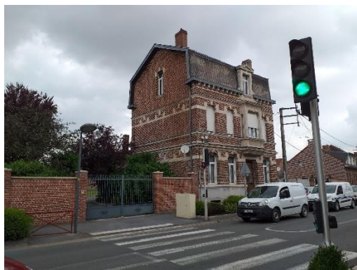
Figure 2 – Feu et passage piétons dans la traversée du centre-ville

Les élus souhaitent faciliter et sécuriser les stationnements et les déplacements (vélos, voitures, personnes à mobilité réduite, etc.) en direction du cœur de ville et des équipements publics.