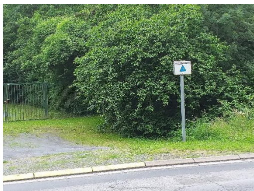
Figure 9 - Assurer la défense incendie est un des enjeux

Le territoire est soumis à des risques naturels. Ces risques sont présents au travers de l'aléa remontées de nappes sur plusieurs secteurs de la commune et notamment dans la plaine de la Scarpe. Les élus souhaitent également proposer une bonne gestion de ses déversoirs d'orage afin de limiter les risques lors des fortes périodes de pluie.