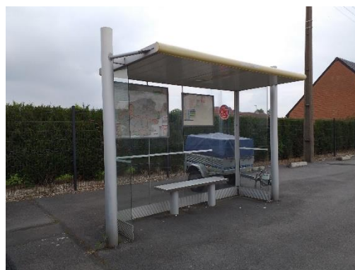
Figure 3 - Arrêt de bus du réseau Evéole

La commune est desservie par les bus du SMTD 2 et de la Région qui desservent notamment les gares de Douai et Orchies. Les élus souhaitent favoriser l'accès aux arrêts de bus afin d'en rendre l'utilisation plus facile.