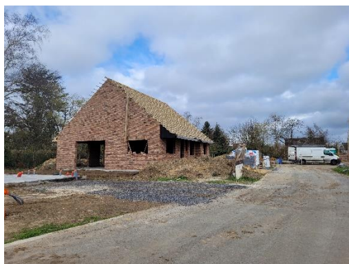
Figure 5 - Construction d'un nouveau logement en cours

L'objectif démographique visant à atteindre 2750 habitants à l'horizon 2040 se traduit par un besoin de l'ordre de 196 logements. Le potentiel identifié au sein de l'enveloppe urbaine permet d'envisager la production d'environ 90 logements (potentiel en dents creuses au sein de la Partie Actuellement Urbanisée ainsi que les permis déjà accordés). Reste un potentiel d'une vingtaine de logements identifiés en artificialisation interne et externe à l'enveloppe urbaine.