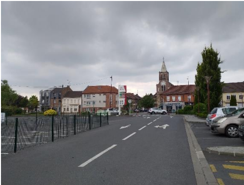
Figure 8 – Centre du village

Le centre du village présente une architecture et un urbanisme typique des villages du Nord : utilisation de la brique et des tuiles, parvis de l'église, petites rues étroites et place centrale dans le centre-ville. Tous ces éléments présentent une unité que le PLU préserve. Les extensions récentes présentent au contraire une variété architecturale que le PLU permet de développer.