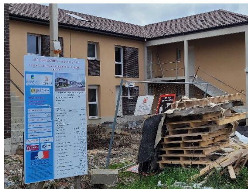
Figure 6 – Opération de construction d'une opération mixte de logements

A travers le logement, la commune ambitionne également de favoriser la mixité des fonctions, dans le but de limiter les déplacements et d'améliorer la qualité de vie des habitants.